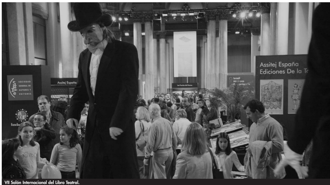
VII Salón Internacional del Libro Teatral.