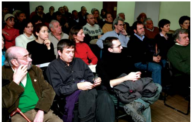
Alfonso Sastre entre el público.