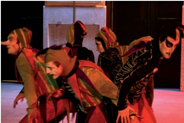
Clowns de La Fábrica de Sueños.