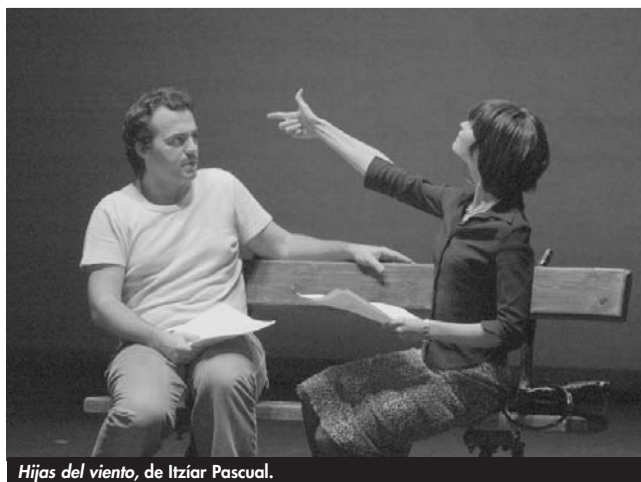
Hijas del viento , de Itziar Pascual.