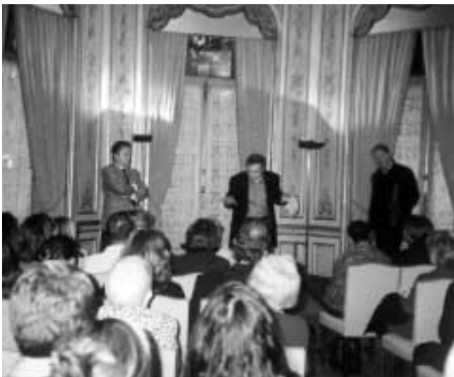
Lectura del Premio Teatro Exprés.

Se estima una asistencia aproximada de unos 300 espectadores por cada una de las lecturas ofrecidas en Badajoz y Huelva, y unos 100 en las de Madrid, con lo cual la participación total se cifraría en unas 5.300 personas.