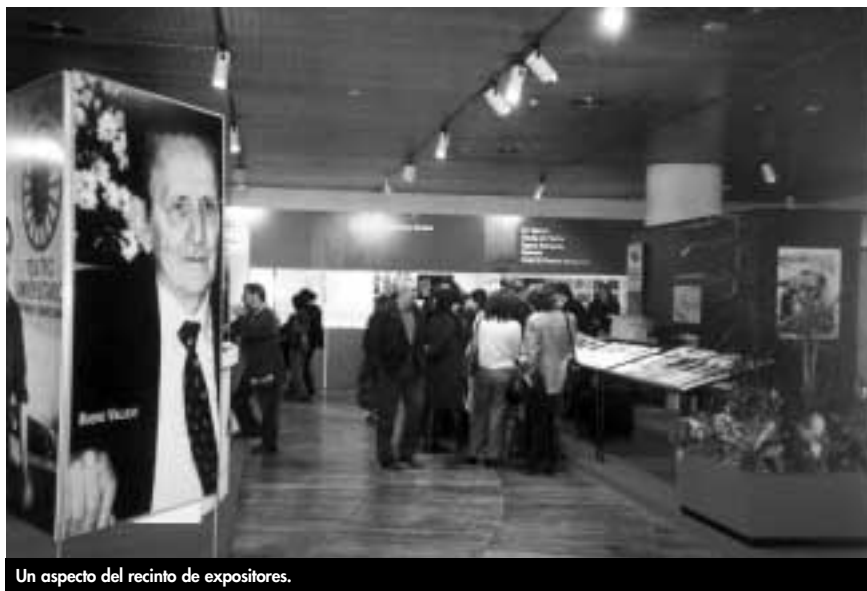
Un aspecto del recinto de expositores.