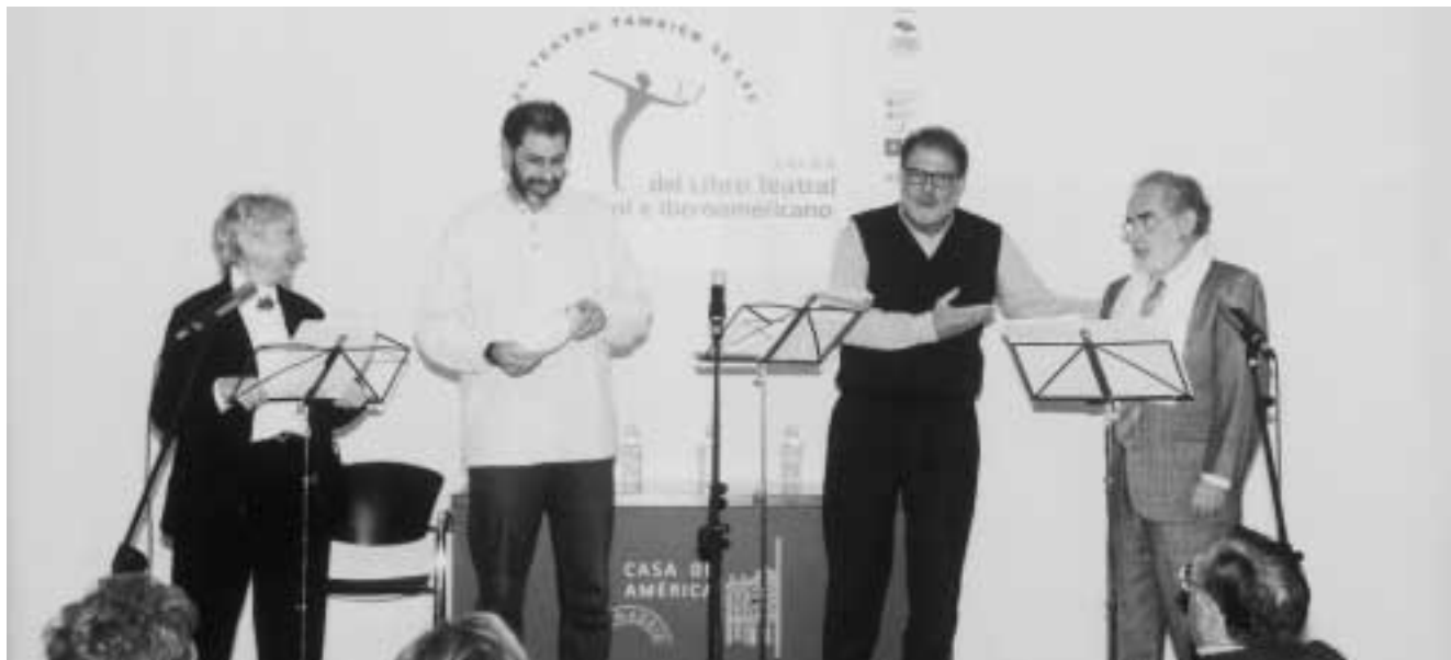
Berta Riaza, Robert Muro, Juan Luis Galiardo y Teófilo Calle, interpretan La muerte y el genocidio de Rafael Gordon.