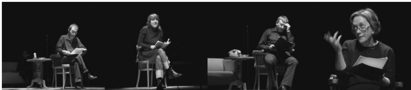
Distintas lecturas del Tercer Maratón de Monólogos celebrado en Barcelona.