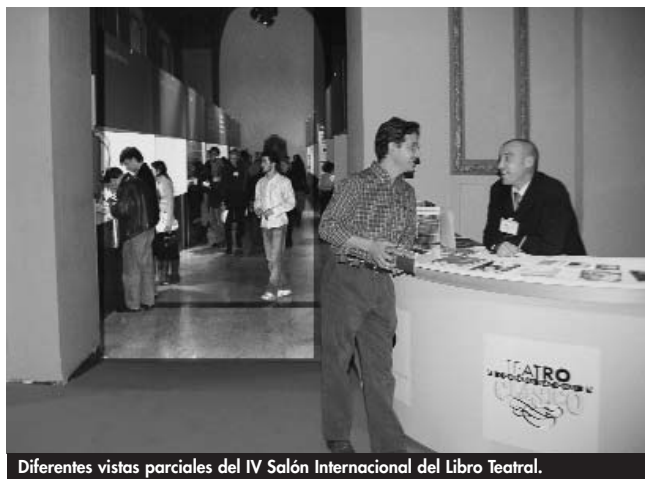
Diferentes vistas parciales del IV Salón Internacional del Libro Teatral.